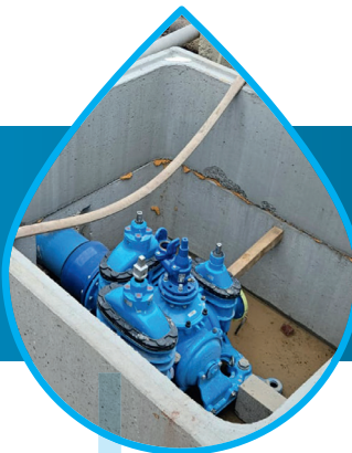
2. Hawle Combiflex