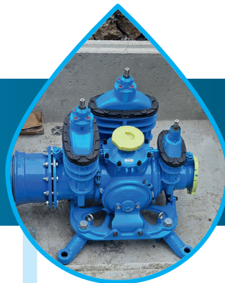
3. Hawle Combiflex